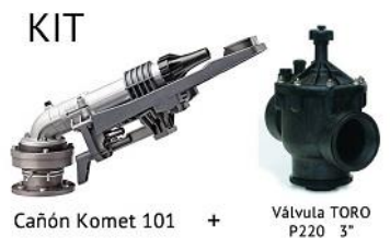
Cañón Komet 101 +

KOMET 101 ULTRA Alcance teórico 27,7–54,2 m Presión de trabajo 2,5–6,5 bar Caudal 9,6 – 56,4 m³/h Trayectoria 24° Boquilla 7 tipos de boquillas, de 12 a 24 mm. Incluye boquilla 22 Entrada 2" Rosca Hembra Ahorros energéticos La gran versatilidad del cañón se potencia aun más con el rompedor de chorro intermitente dinámico. El sistema de riego funciona a menor presión, lo que permite ahorros energéticos y reduce los costes operativos del sistema.