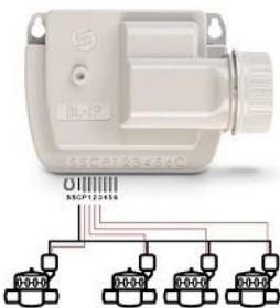
BL-IP1 (1 estación)